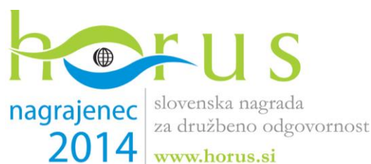
Slika: Logotip nagrade HORUS, kot ga uporabljajo nagrajenci 2