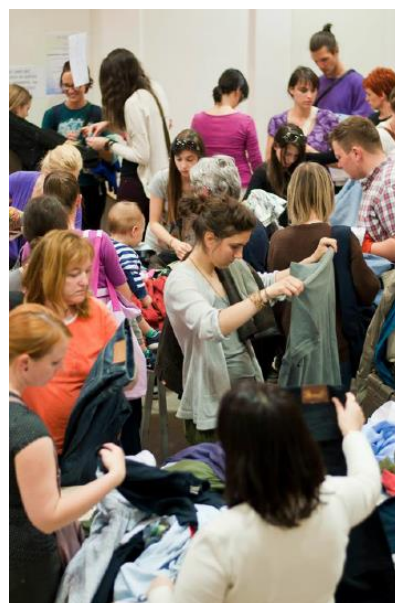
Slika: izmenjevalnica oblačil